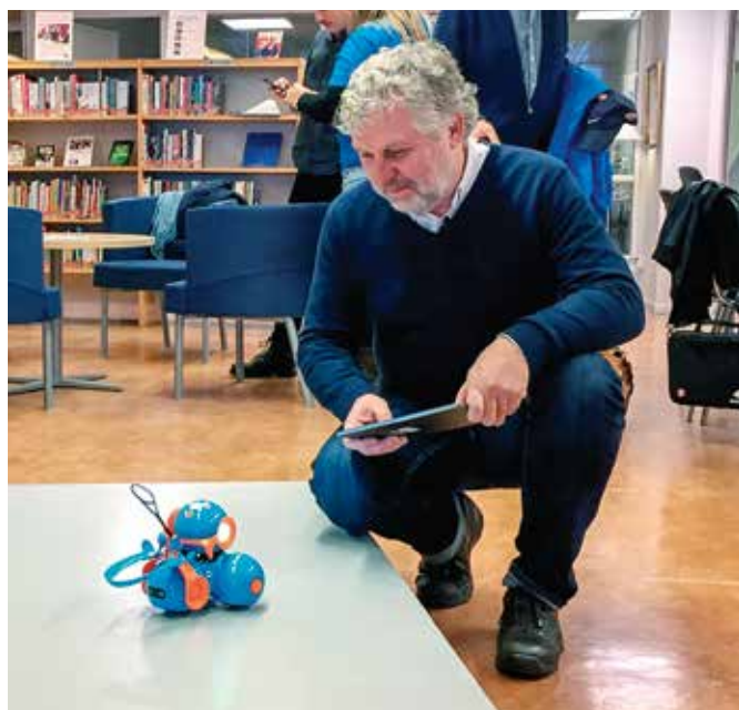
Digitaliseringsminister Peter Eriksson i samspråk med vår robot Dash.

I juni kom sedan beskedet att regeringen avsatt medel, som via Internetstiftelsen skulle användas till att starta 5-10 nya DigidelCenter med Motala som nationell modell. Så här skrev Peter Eriksson i pressmeddelandet "Jag har själv besökt Motala och är väldigt imponerad av verksamheten där. Digidelcentret är en mötesplats där människor som känner sig ovana med den nya tekniken får hjälp att lösa problem eller komma igång med att använda digitala tjänster. Det är Sverige när det är som bäst!"