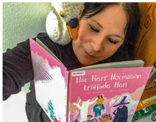
Biblioteket i Valdemarsvik är den mest besökta institutionen i kommunen.