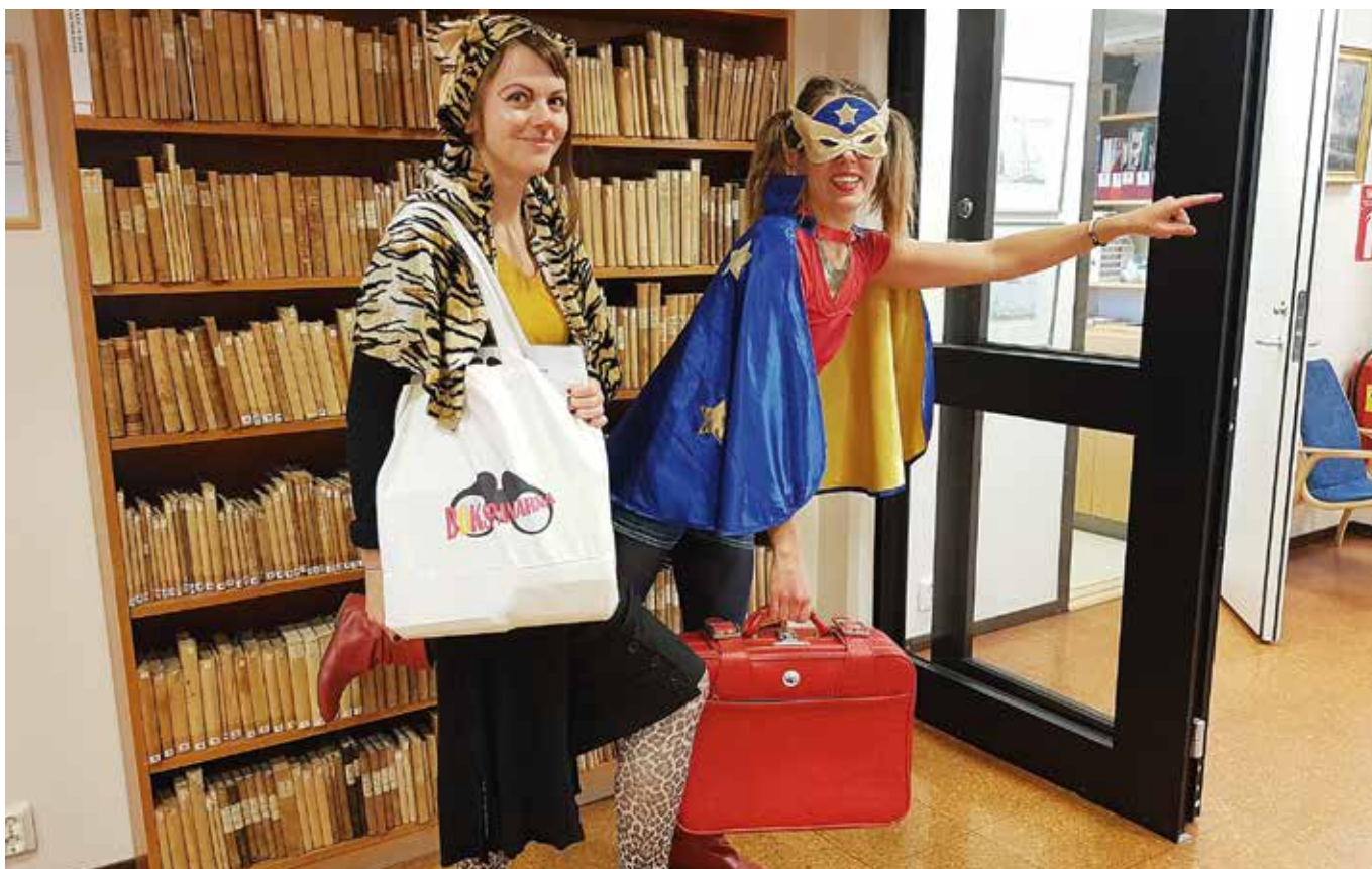
Bokspanarna på uppdrag är en del i bibliotekets utåtriktade verksamhet för barn och unga.