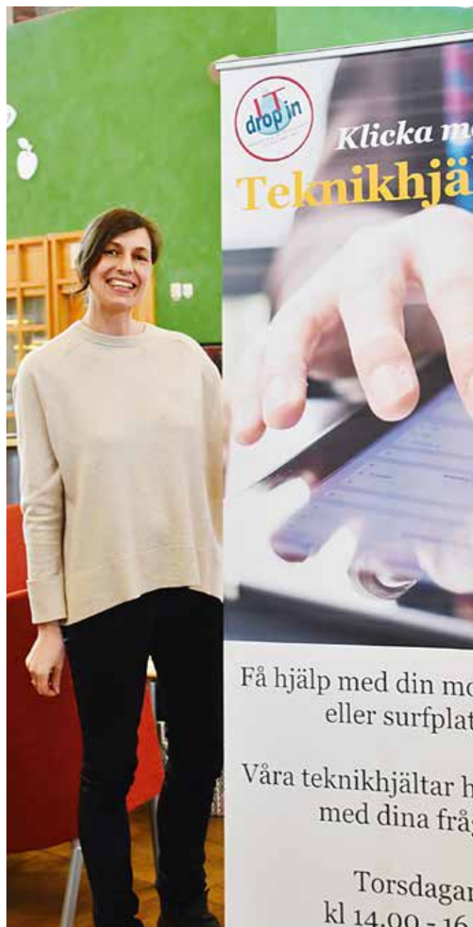
Fyrtiofyra procent av teknikhjälpens besökare vill ha hjälp med sin laptop.

Det övergripande syftet är att bidra till ett ökat digitalt kunnande och intresse snarare än att bara vara en snabbhjälp för stunden. Vi som sitter i Teknikhjälpen får också lära oss mycket själva. Ofta är det frågor vi inte kan svara på direkt och då får vi utforska pro-