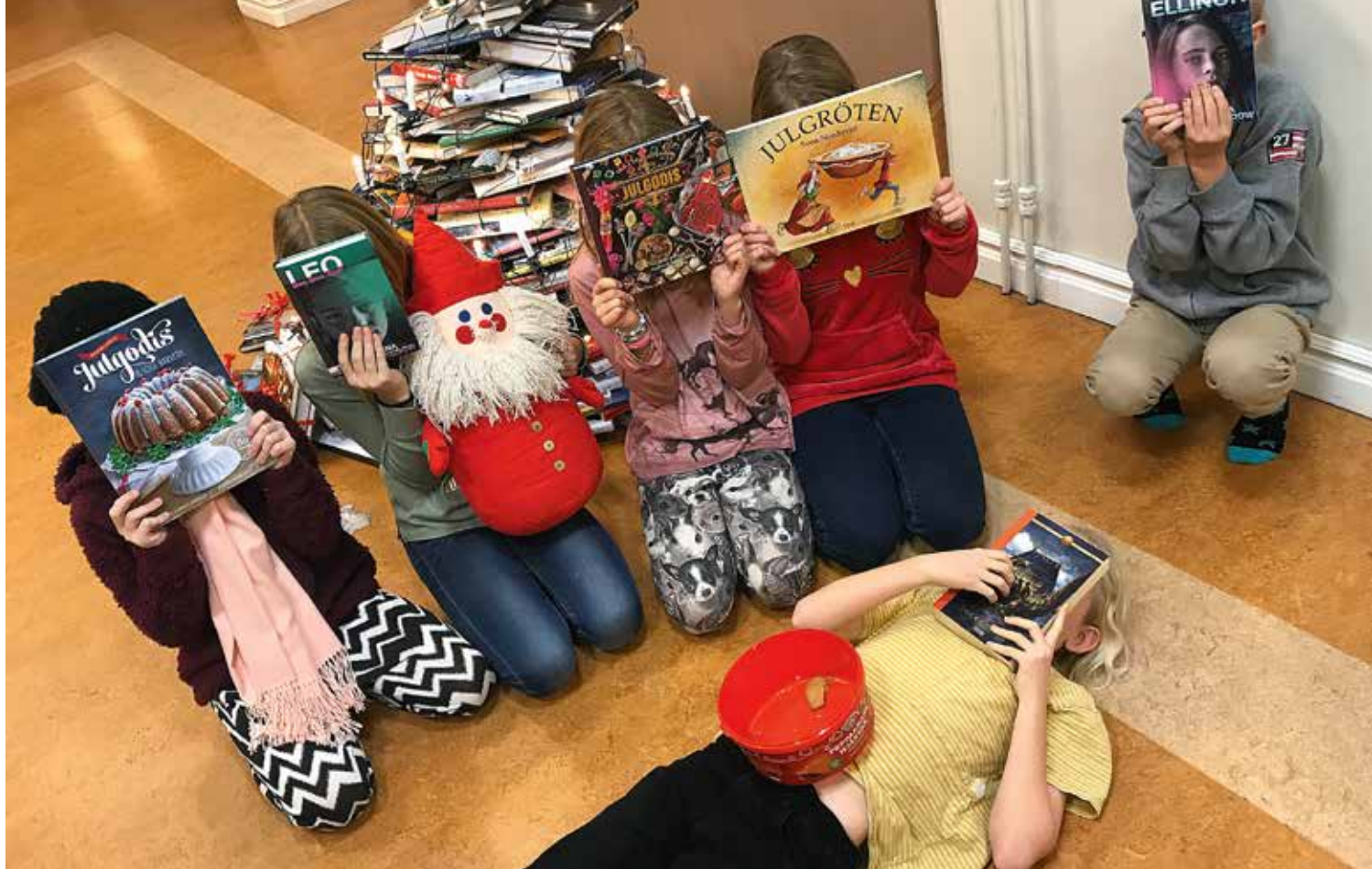
Mot jultiden blev sagoläsningen väldigt temainriktad.

stor publik med cirka 70 tonåringar från högstadieskolan Petrus Magni och 30 vuxna. Den var en av höjdpunkterna för året eftersom den handlade om ett ämne som berör oss alla.