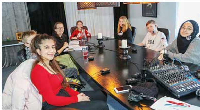
Läslust/pratlustprojektet spelar in sina bokdiskussioner som sedan sänds i närradion.