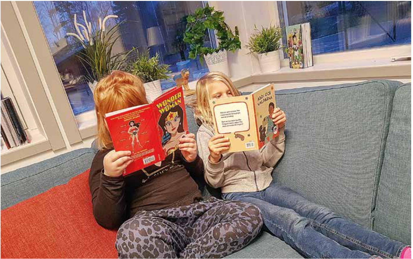
Bokkassar med lättlästa böcker cirkulerar runt bland kommunens fritidshem.