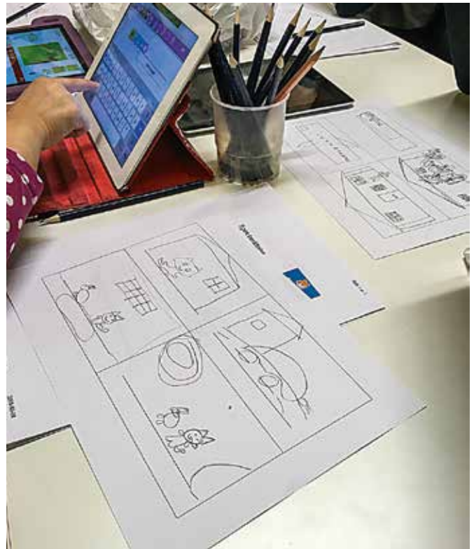
Att skapa egna bildberättelser var populärt.