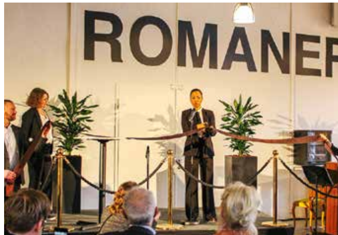
Dåvarande kulturminister Alice Bah Kuhnke inviger det nya biblioteket.

Flytten har inneburit många skiften och nya sätt att arbeta. En ny arena har tagits i bruk. Många rutiner och arbetsuppgifter har ändrat karaktär. Vi har utmanats. Att ta hand om en kaffe- och varuautomat? En plats som var välbekant, familjär och trygg, har lämnats. Det nya biblioteket fungerar för möten, upplevelser, kreati-