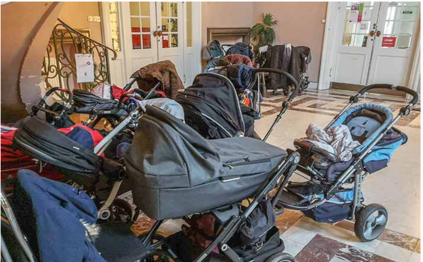
Under året anordnades en mängd aktiviteter för små barn och deras vuxna.

Vår integrationssatsning i samarbete med Svenska med baby har fortsatt med besökare från länder som Polen, Eritrea, Somalia, Syrien, Sudan, Iran, Afghanistan, Finland, Angola, Storbritannien, Frankrike, Rumänien med flera. Nytt för året är att Norrköpings kommun ansökte om bidrag hos Länsstyrelsen för att bedriva Svenska med baby på Norrköpings stadsbibliotek. Detta