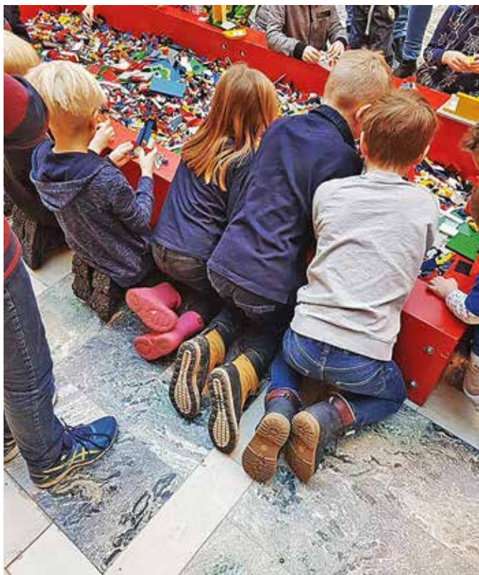
Legofesten drog hundratals extra barn.