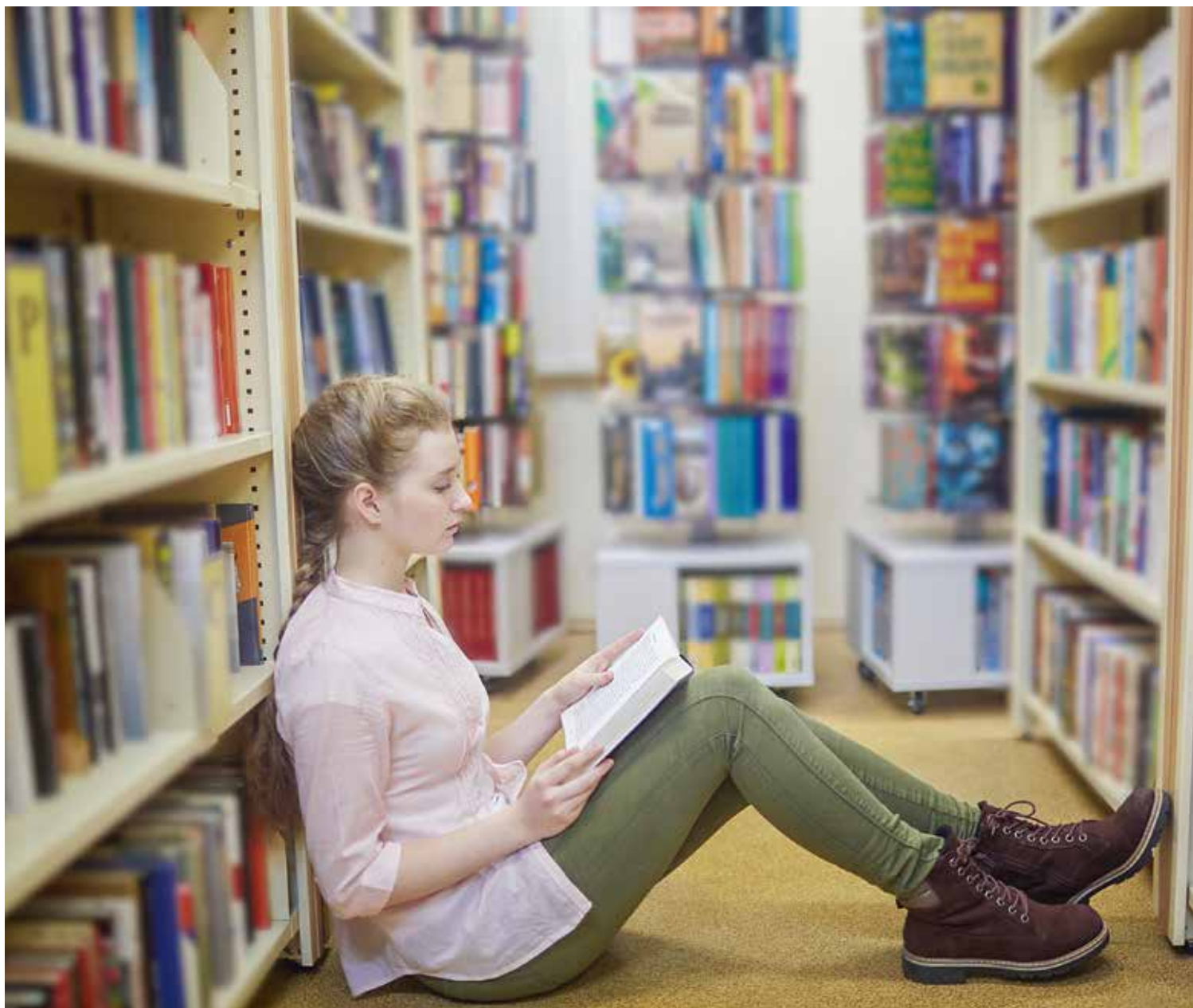
Bibliotek och böcker ses som omistliga av många. Hur kan biblioteken möta det behovet fullt ut?

Hur ska biblioteken kunna möta dessa behov? Vad skulle bibliotekspersonalen behöva öka sina kunskaper i för att kunna hjälpa dessa människor?