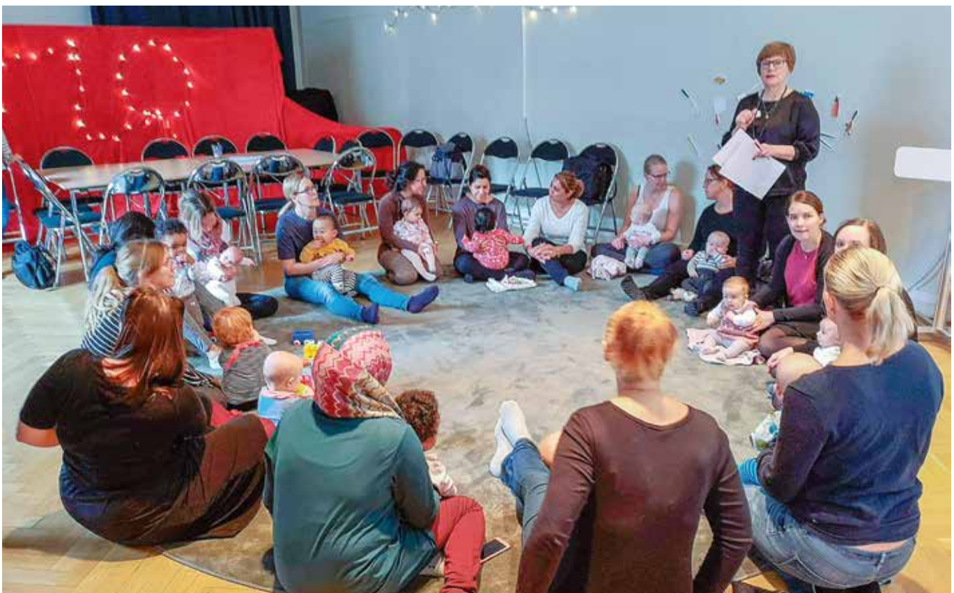
Varje vecka leder en barnbibliotekarie Svenska med baby, berättar om programmen på biblioteket och ger boktips.