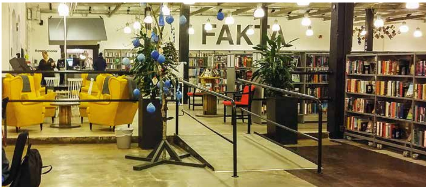
Många rutiner och arbetsuppgifter ändrade karaktär i den nya byggnaden.