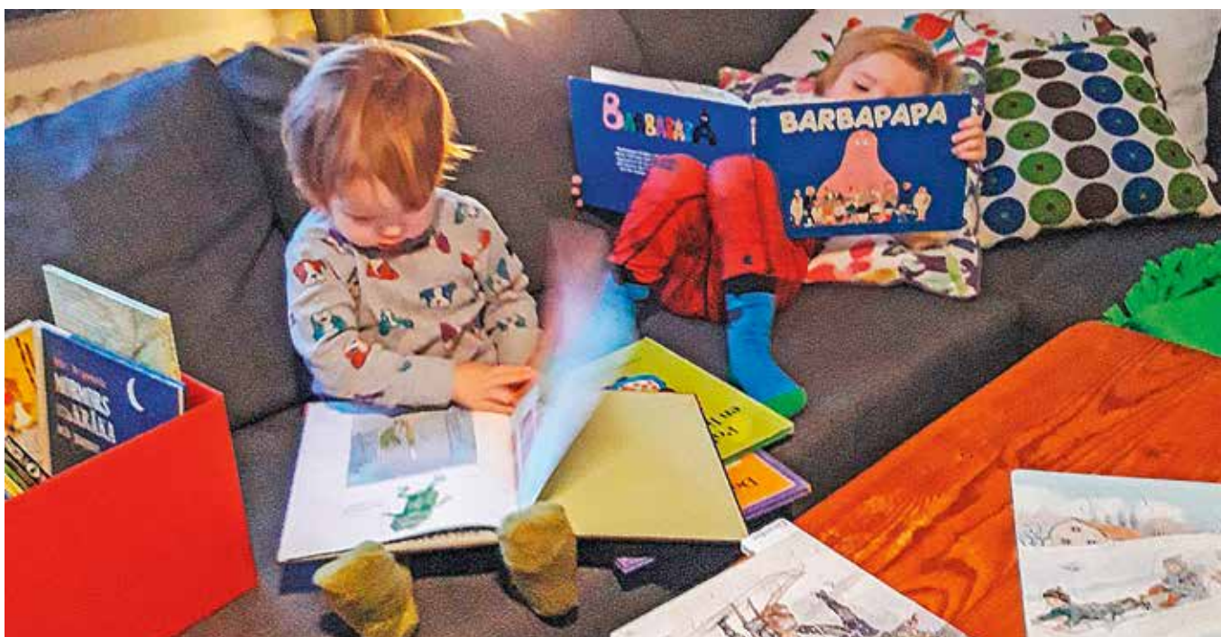
Inom Bokstart gör bibliotekarierna hembesök, läser högt och pratar om vikten av att läsa tillsammans.