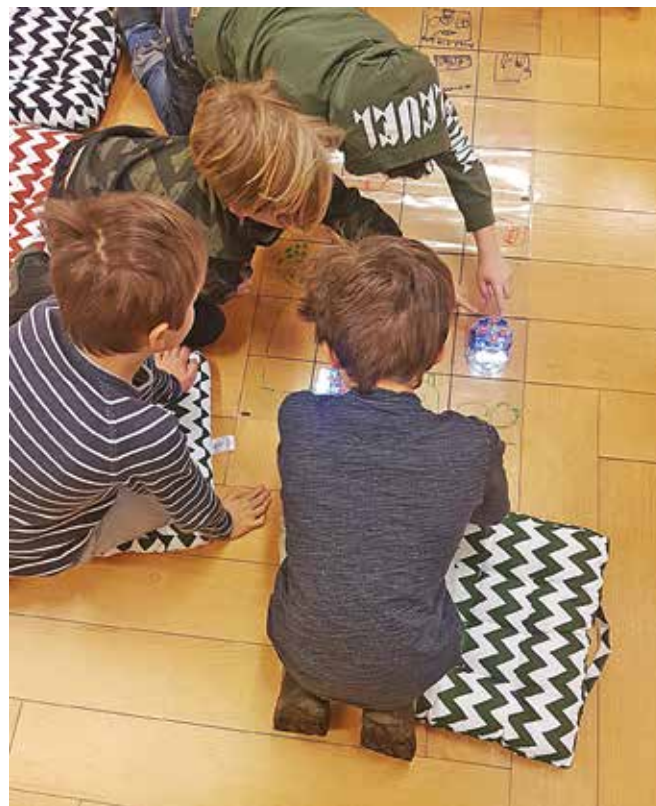
På sportlovet fick barn lära sig grunderna i programmering i en scratch och bluebot-workshop.