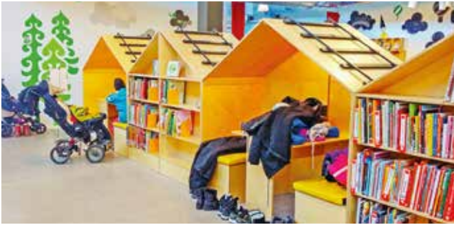
Aktiviteter för de små är populära, oavsett om det är pyssel eller sagoläsning.