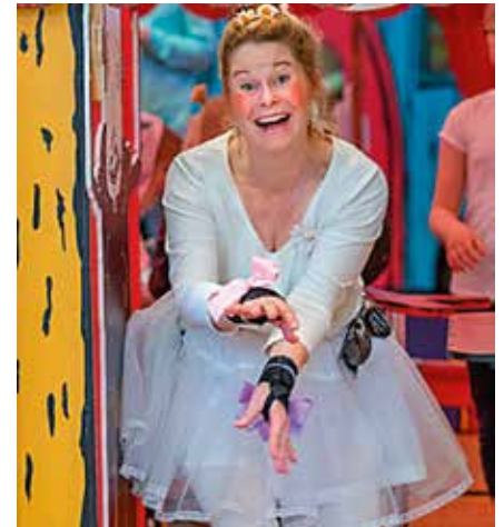
Sagostunder om trollkarlar, monster och drakar och Widmark-mysterium med påtaglig känsla av cirkus.