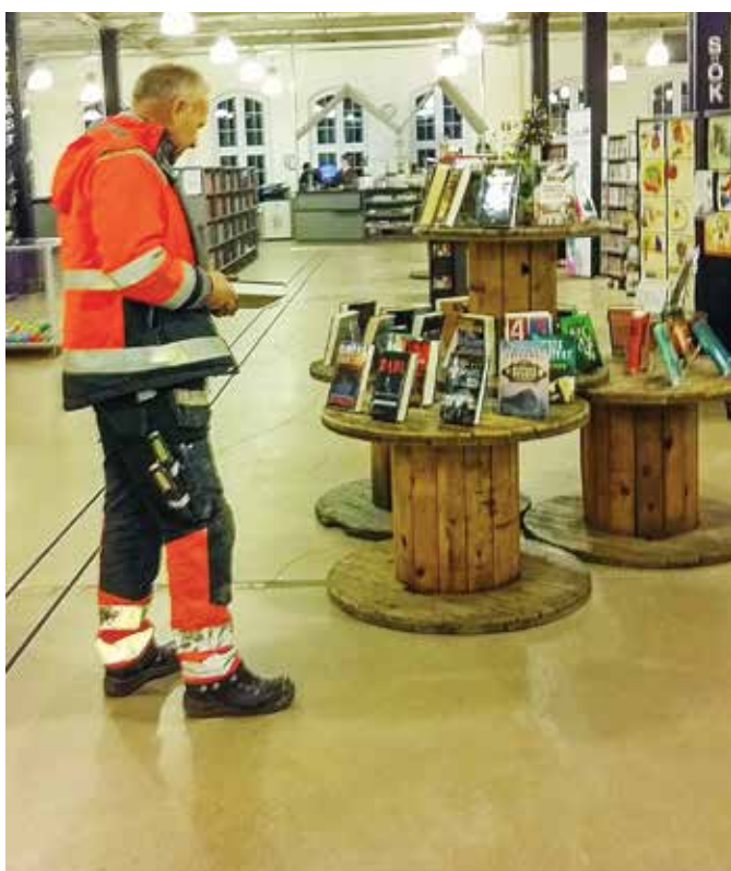
Det nya biblioteket fungerar för bokfunderande, upplevelser, möten mm.