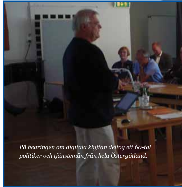
På hearingen om digitala klyftan deltog ett 60-tal politiker och tjänstemän från hela Östergötland.