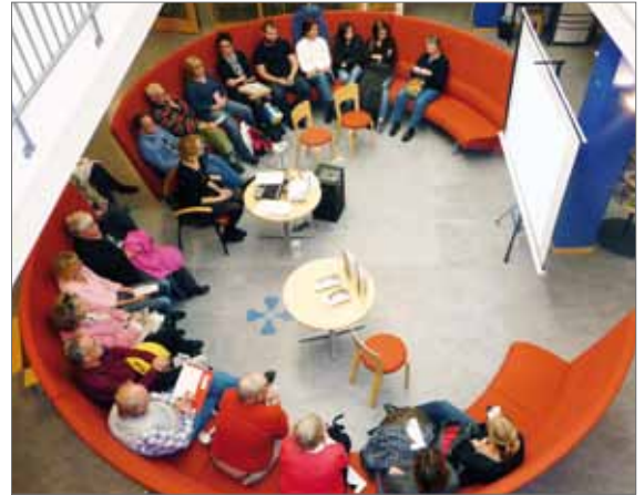
Surfa Lugnts föreläsning i Mjölby.

– Det har också fungerat väldigt bra! Har tyckt att vi har haft lagom nivå på föreläsningarna. Vet att det är svårt att locka åhörare och det har skiftat väl-