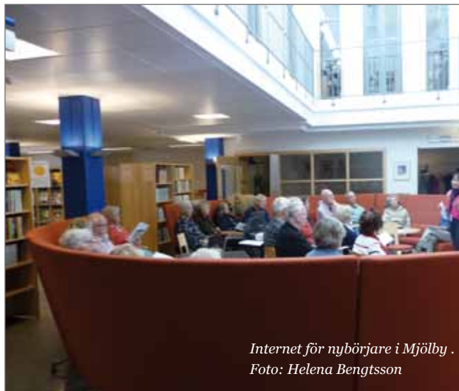
Internet för nybörjare i Mjölby.