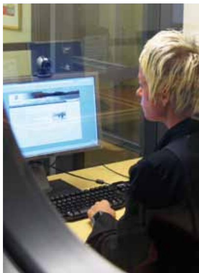
Studierum i Söderköpings bibliotek.