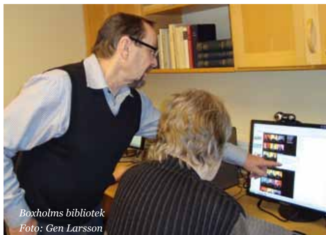
Boxholms bibliotek

Vår inriktning är den digitala klyftan och samarbete med studieförbund. I samarbete med Medborgarskolan har vi haft tre parallella gratis studiecirklar datagrund/Internet för nybörjare i gång hela 2009. Vi har utbildat 72 personer i dessa studiecirklar, varav hälften under hösten.