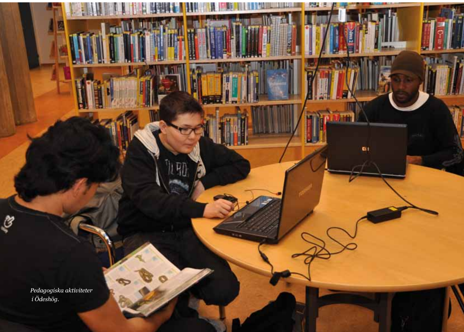
Pedagogiska aktiviteter i Ödeshög.