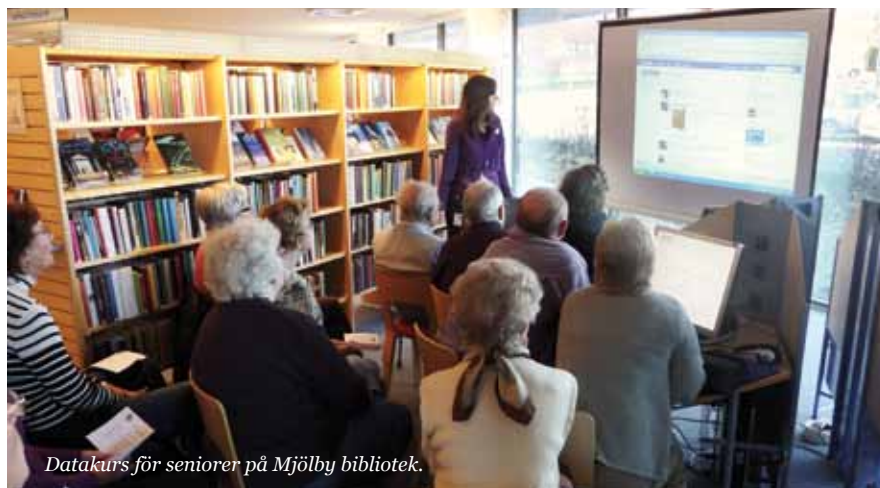
Datakurs för seniorer på Mjölby bibliotek.

Mjölby bibliotek har de senaste åren upplevt en stor efterfrågan på "datakurser", främst från seniorer. Upplägget för årets e-kampanj blev ett utmärkt tillfälle att dels erbjuda lärorika och intressanta programpunkter för dem som vill bli bättre på att använda datorer, dels kunna testa olika former av aktiviteter för att se vad som skulle fungera bäst och uppskattas mest.