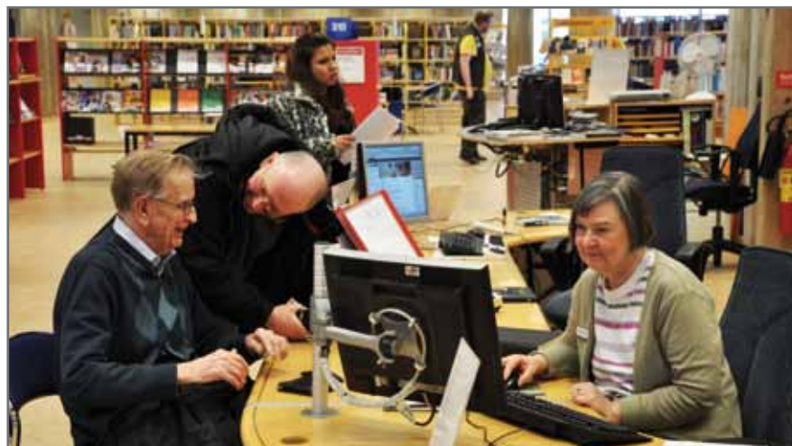
Stadsbiblioteket i Norrköping.

Nio kommuner deltar och driver delprojekt som stöds med projektmedel: Boxholm, Finspång, Mjölby, Motala, Norrköping, Söderköping, Vadstena, Åtvidaberg och Ödeshög. Biblioteken har fått välja vilken eller vilka inriktningar man vill ha på sitt projekt. Samtliga projekt har inriktat sig på